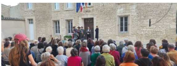
SUCCÈS DES 3 MOUSQUETAIRES