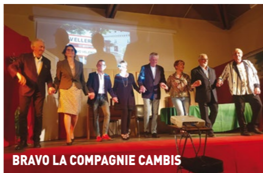
BRAVO LA COMPAGNIE CAMBIS